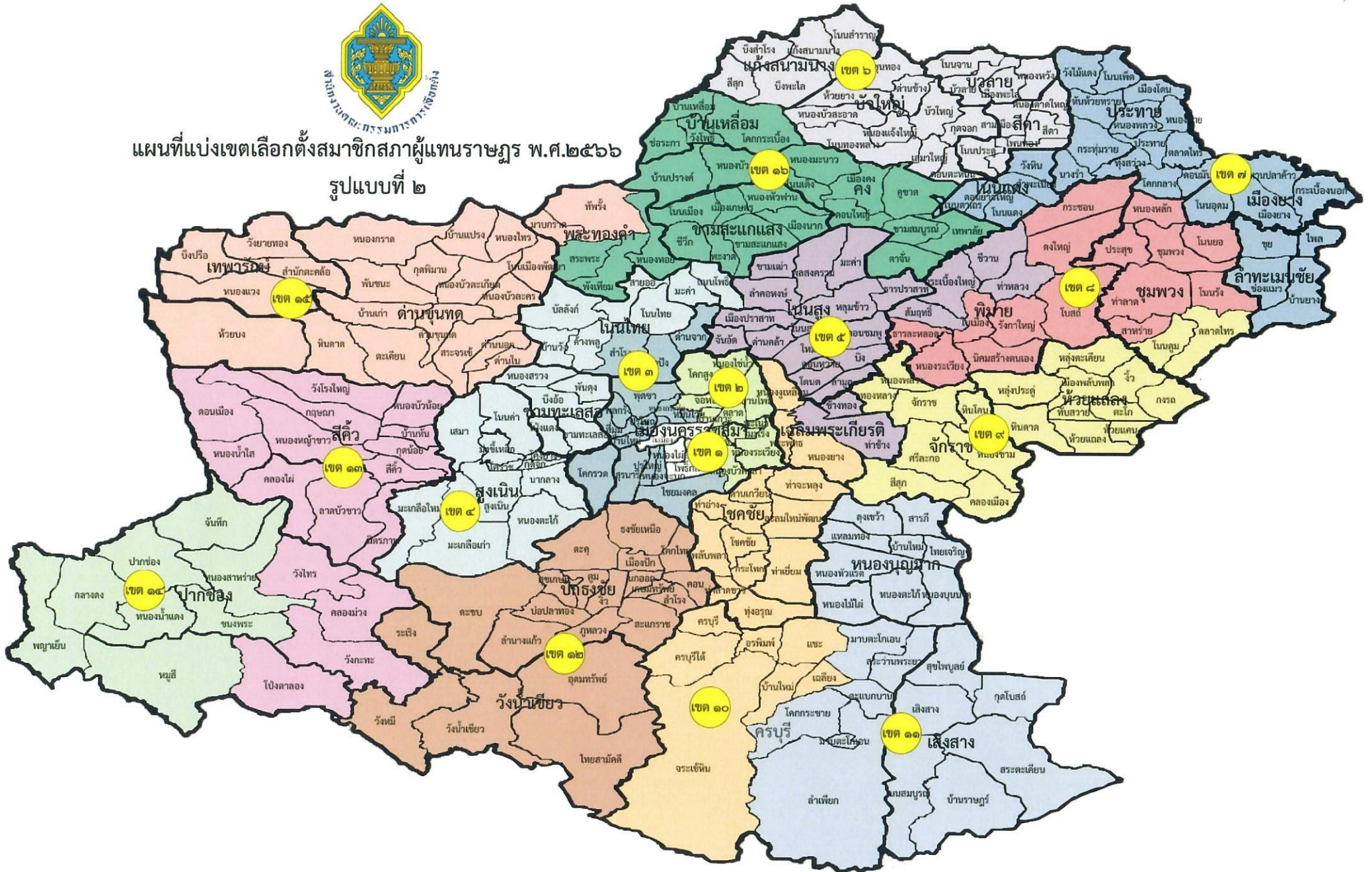
รูปแบบที่ ๒