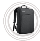
Lenovo Casual Backpack B200