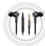
Lenovo 500 Extra Bass In-Ear Headphone