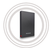
Lenovo UHD F309 1TB Portable Secure Hard Drive