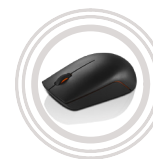
Lenovo 300 Wireless Compact Mouse